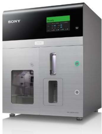
全自動セルソーター SH800S/MA900