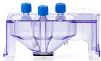
カートリッジサイズ (L×W×H) 30 x 95 x 50 mm

誰でも簡単に取り扱えるシンプルな操作性に加え、ドロップレットを形成しないエアロゾルフリーの安全なソーティングが可能になります。デモンストレーションにて、MACSQuant Tytoによるユニークなソーティング原理、簡便な設定/操作性能をこの機会にぜひご体感ください。